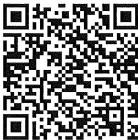
Inquadra il QR Code Modello di competizione categoria Primi Calci U8/U9

Utilizzare lo spazio note per riportare elementi rilevanti sull'attività conclusa. Riportare altresì eventuali provvedimenti disciplinari a carico di dirigenti e tecnici (riportando cognome, nome, società di appartenenza, minuto/tempo e motivazione).