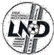
FIG.C. - C.R.TOSCANA - L.N.D.